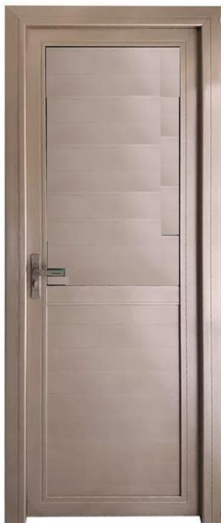
盥洗室、厕所浴室门

盥洗室、厕所、浴室安装铝钛镁镶板门 6 樘，材料 1.4 厚，单包边。样式见下图，颜色现场业主定。